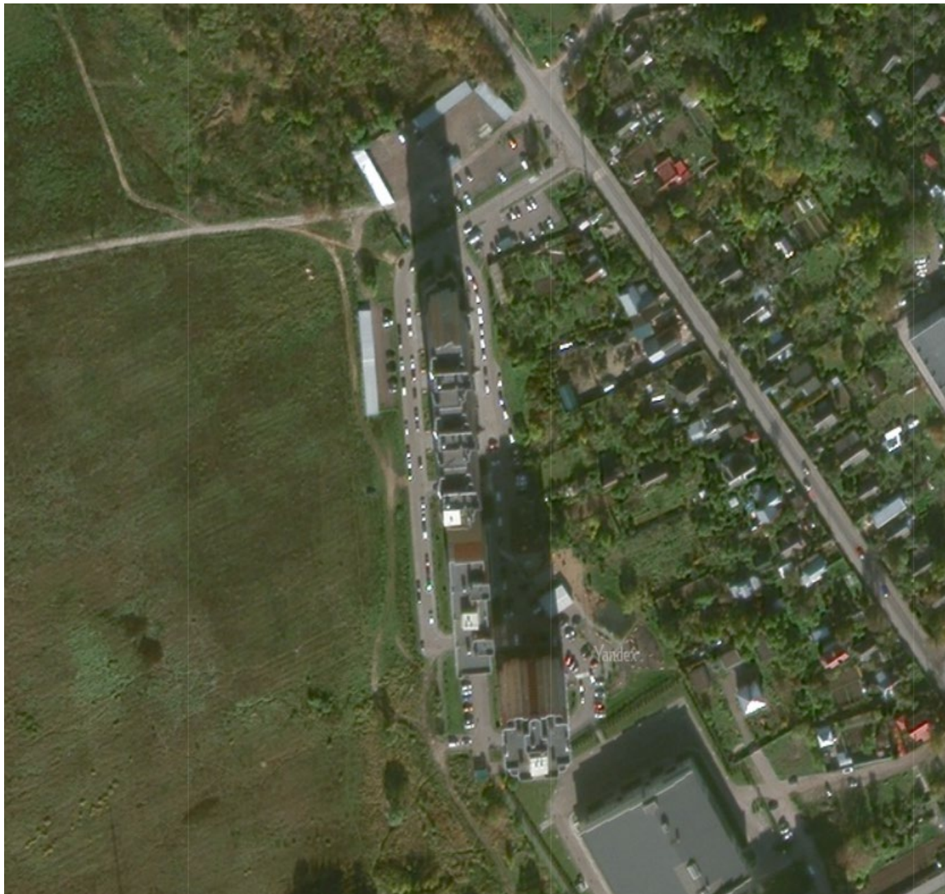
Рисунок 1. Спутниковый снимок объекта